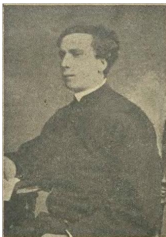
Książę Edmund Radziwiłł