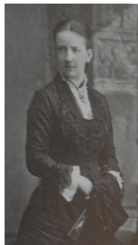
Księżna Elżbieta Radziwiłłówna