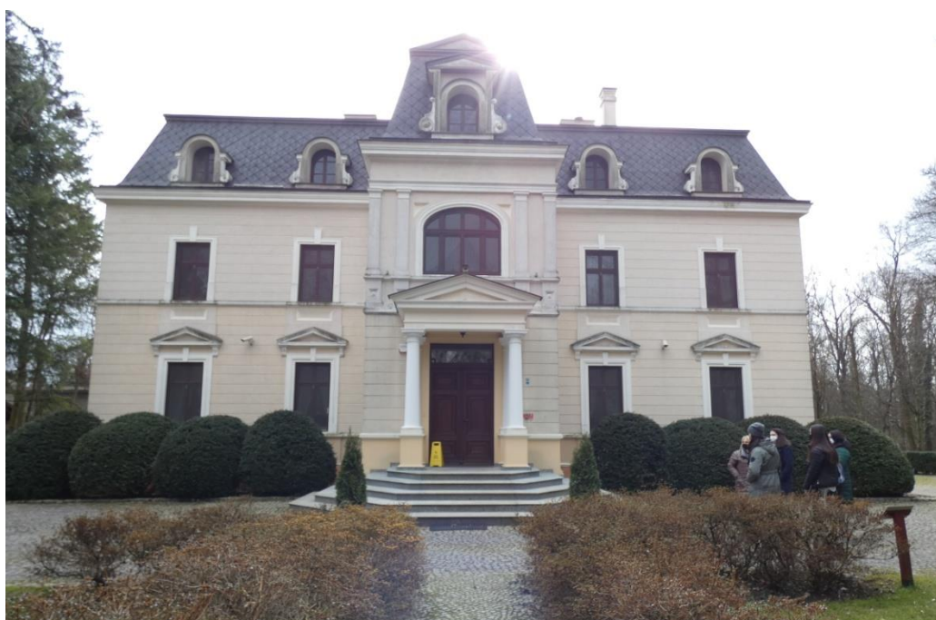
Bagatela - pałac