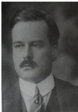
Książę Władysław Radziwiłł