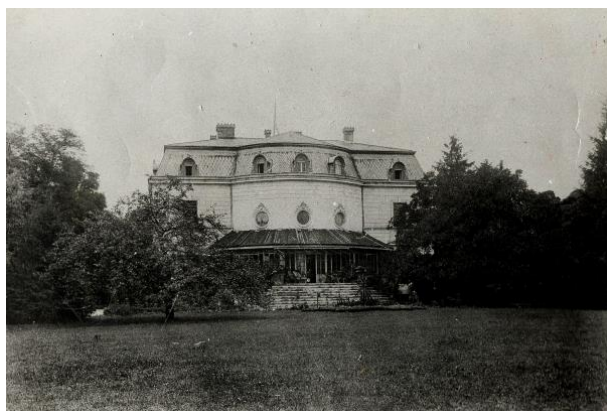
Bagatela 1912 r.