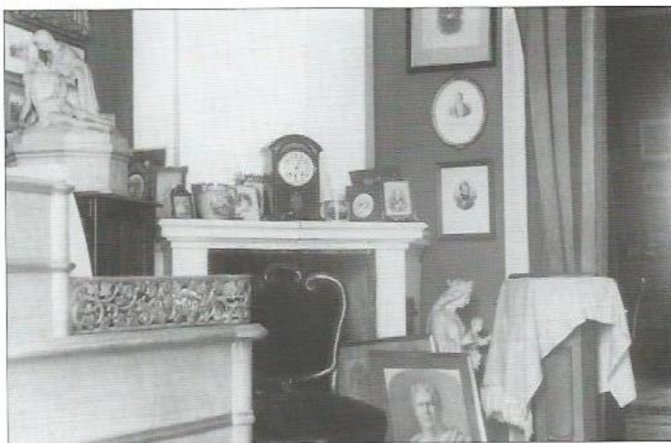
Bagatela, wewnątrz pałacu przed 1939 r.

Po zakończeniu II wojny światowej pałacyk w Bagateli podzielił losy sąsiedniej rodowej ordynacji Radziwiłłów w Przygodzicach i podobnych im majątków w Polsce i na mocy Dekretu PKWN o reformie rolnej z 1944 roku został znacjonalizowany przez władze komunistyczne. Początkowo opuszczony pałac przeznaczony został na mieszkania lokatorskie m.in. dla byłej służby dworskiej, a następnie przejęły przez Lasy Państwowe, które urządziły w nim pomieszczenia biurowe Nadleśnictwa przeniesionego z Lewkowa oraz mieszkania służbowe dla swoich pracowników.