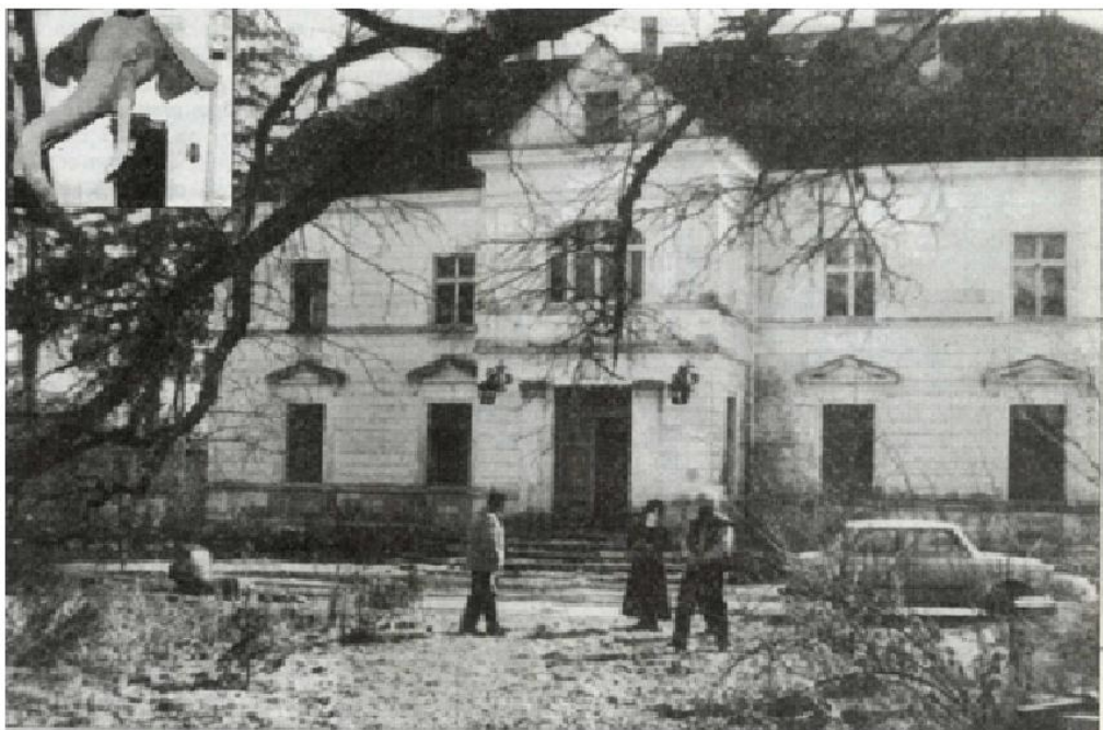
Urszula, Józef (z prawej) i Władysław Gdulowie zawsze chętnie witają gości w swoich progach. W lewym rogu najcenniejsze z łowieckich trofeów księcia Radziwiła.