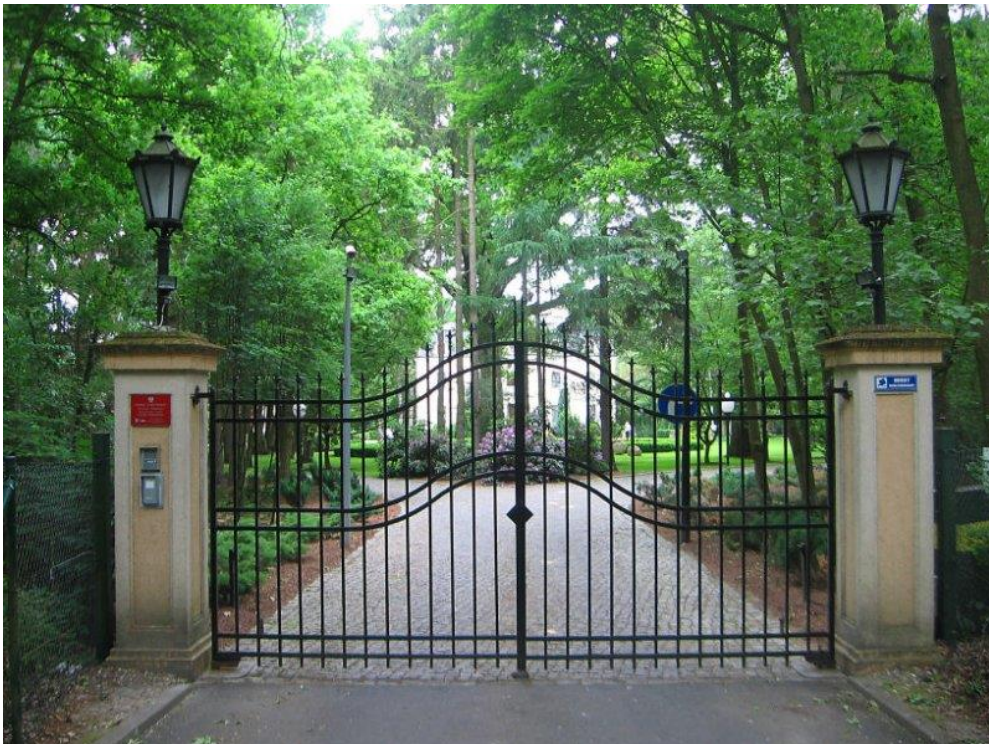
Bagatela - brama