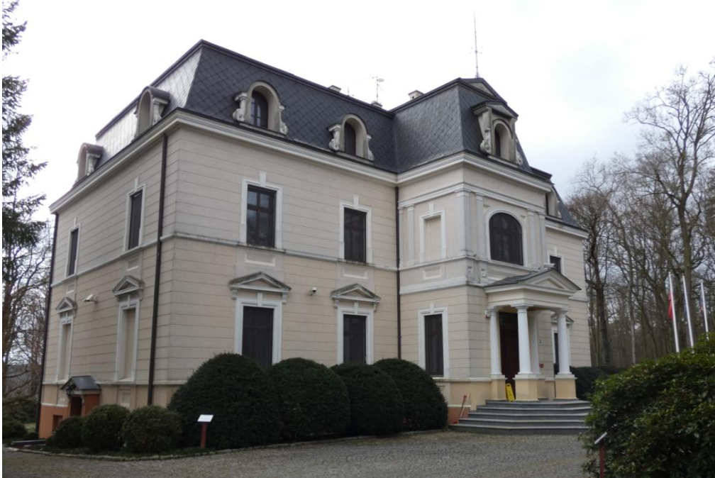
Bagatela - pałac